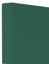
2FTR-ISO COARSE 65% (G4)-DEPURO PRO 150