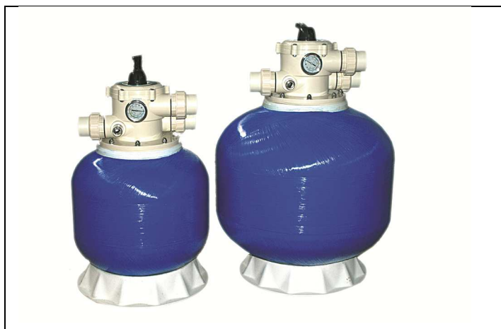
filtro a sabbia mod. Mediterraneo Top