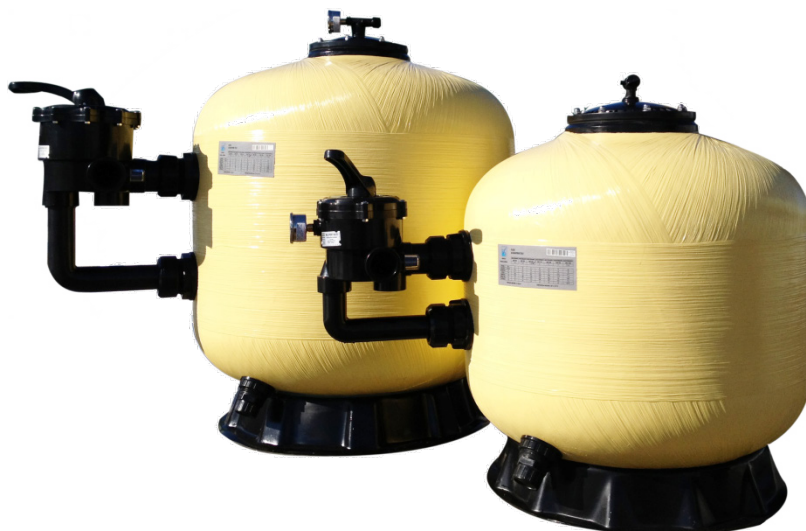
filtri a sabbia mod. Mediterraneo – ver. 2013