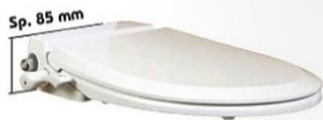
Dimensioni standard - Standard dimensions